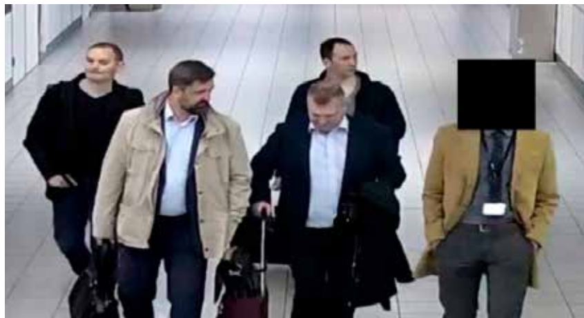
De uitgezette Russische spionnen en hackers die probeerden 'OPCW-data' te stelen.

(OPCW) en het Internationaal Gerechtshof, die als doelwit op de 'shortlist' staan van de Russische inlichtingendiensten. De Nederlandse inlichtingen- en veiligheidsdiensten constateren na de "grootschalige uitzetting" in Europa van Russische spionnen onder diplomatieke dekmantel, het gebruik van "andere tactieken". Zo is de inzet opgevoerd van "gelaagde netwerken. Deze netwerken bestaan uit coördinatoren, facilitators en zogeheten low-level agenten die de sabotageacties uitvoeren"; - de 'nuttige idioten'. Het gaat hierbij om uiteenlopende personen onder wie "bevriende en sympathiserende journalisten, media, (Euro)parlementariërs, organisaties e.a. De diensten stellen ook vast dat het algehele Russische (anti-westerse) narratief een positief onthaal krijgt in met name de "anti-institutioneel-extremistische beweging" in Nederland. Poetin wordt gezien als 'de verlosser' die de strijd aanbindt tegen "de kwaadaardige elite in het Westen en die de door deze kwaadaardige elite gedomineerde internationale orde ter discussie durft te stellen".