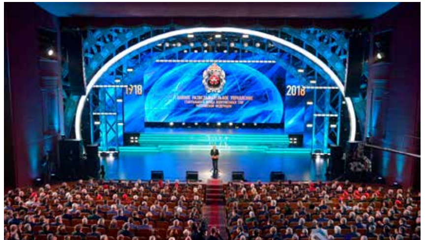
Toespraak Poetin bij het 100-jarig bestaan van inlichtingendienst GROe in 2018.

Als gevolg van de oorlog in Oekraïne is de Russische hybride dreiging in Europa in omvang en brutaliteit, sinds het najaar van 2023, scherp toegenomen. De toorn van Moskou is c.q. wordt met name gewekt door de steun van de meeste EU- en NAVO-landen aan de Oekraïners in hun strijd tegen de