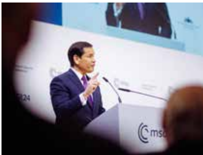
VS-minister van Buitenlandse Zaken Marco Rubio García

waarmee de woorden van Marco Rubio zaterdag in München werden ontvangen, verhulde de harde kritiek die in zijn toespraak verscholen lag. (-) Een staande ovatie. Hoe groot de trans-Atlantische spanning in het eerste jaar van Donald Trump is opgelopen, bleek wel uit de opluchting waarmee de Europeanen zaterdag in München de toespraak van Marco Rubio onthaalden. Een zucht van verlichting ging door de zaal na de mierzoete toenadering van Trumps hoogste diplomaat – waarbij het publiek voor het gemak de frontale aanval negeerde die onder de loftuitingen schuilging. Rubio herhaalde tijdens de jaarlijkse veiligheidsconferentie in wezen de vijandige boodschap waarmee vicepresident JD Vance de Europeanen vorig jaar in de gordijnen joeg, maar meende dat zijn harde kritiek voortkwam uit liefde voor Europa. Rubio was Vance met suikerglazuur. 1