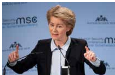
Ursula von der Leyen, voorzitter van de Europese Commissie.

Hoewel de guarapo-benadering van Marco Antonio Rubio García overall leek te werken, bleven veel bedenkingen onaangetaast. Europa kent en houdt vast aan rode lijnen die niet overschreden mogen worden, liet commissievoorzitter van de EU, Ursula von der Leyen optekenen. Als het gaat om “de vrijheid van meningsuiting en digitale soevereiniteit weten wij niet van wijken.” De Trump-administratie en Brussel kijven al tijden over bijvoorbeeld Europese ordeningsregels voor Big Tech.