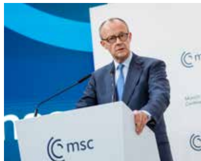
Bondskanselier Friedrich Merz

"MAGA-cultuuroorlogen en protectionisme," zijn niet de weg die Europa moet inslaan. Europa moet zich blijven inzetten voor vrijhandel, klimaatverdragen en de Wereldgezondheidsorganisatie."