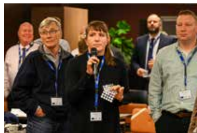
Deelnemers aan het Eurofedop seminar.