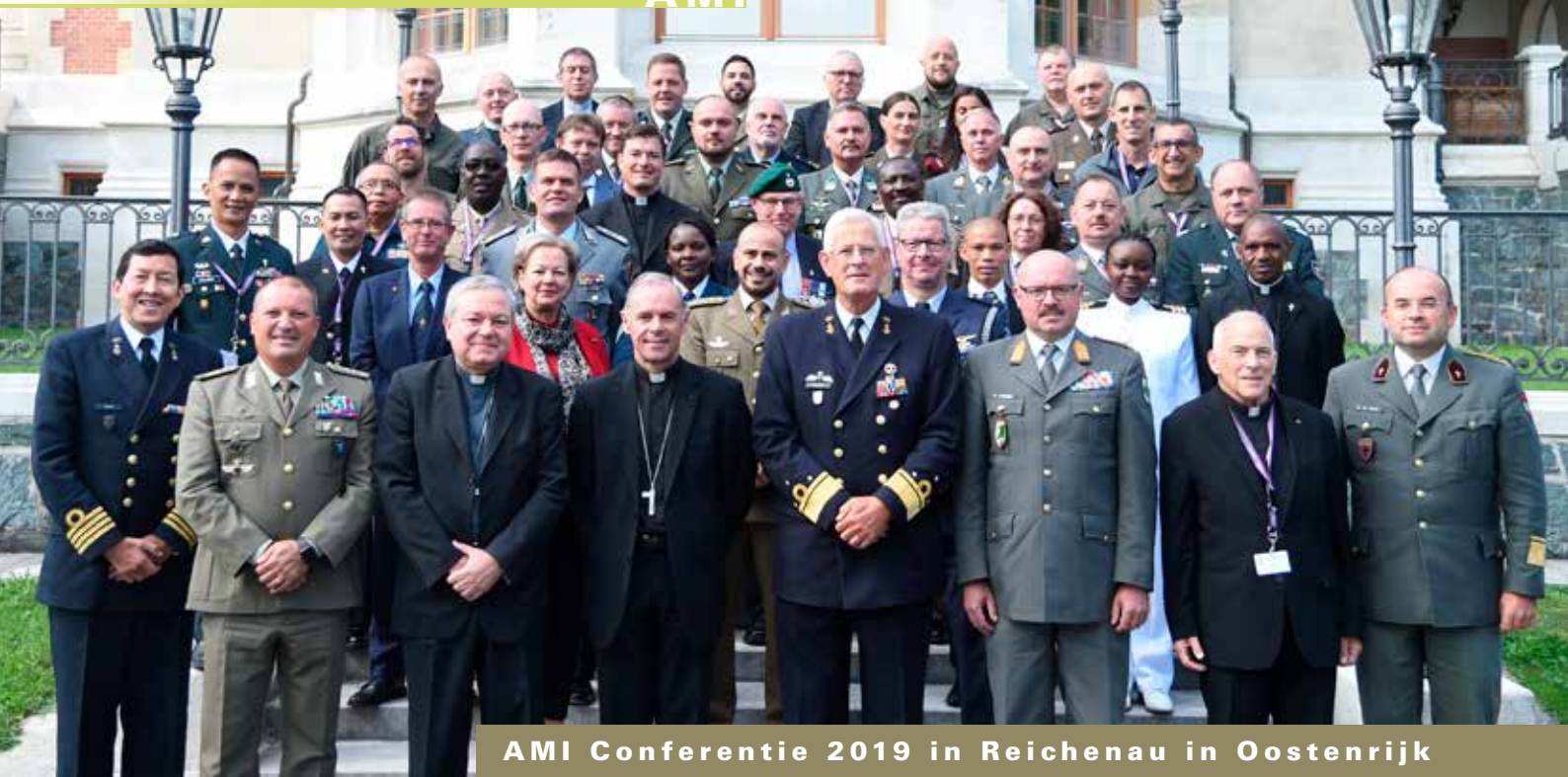
AMI Conferentie 2019 in Reichenau in Oostenrijk