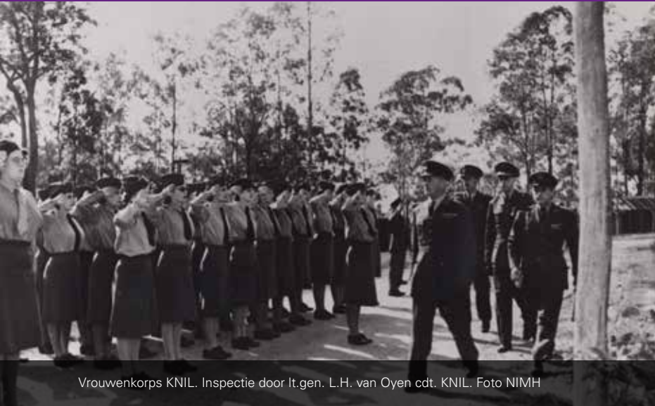
Vrouwenkorps KNIL. Inspectie door lt.gen. L.H. van Oyen cdt. KNIL. Foto NIMH

Dit jaar is het precies 75 jaar geleden dat de eerste vrouwen bij de krijgsmacht kwamen. En om deze historische mijlpaal te vieren begint op 17 oktober 2019 in het Nationaal Militair Museum (NMM) te Soest, de tentoonstelling: '75 jaar vrouwen in de krijgsmacht'.